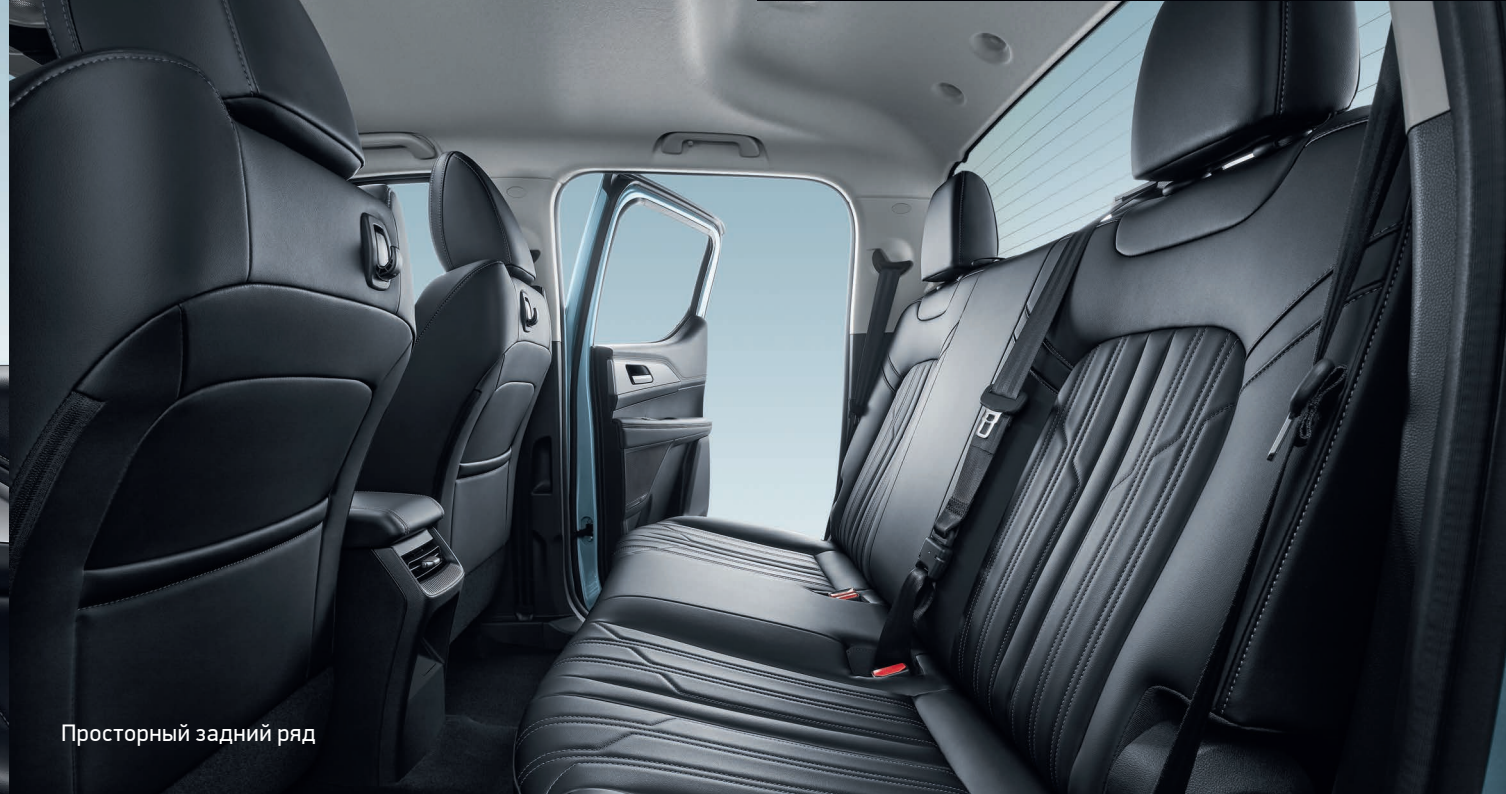
Просторный задний ряд