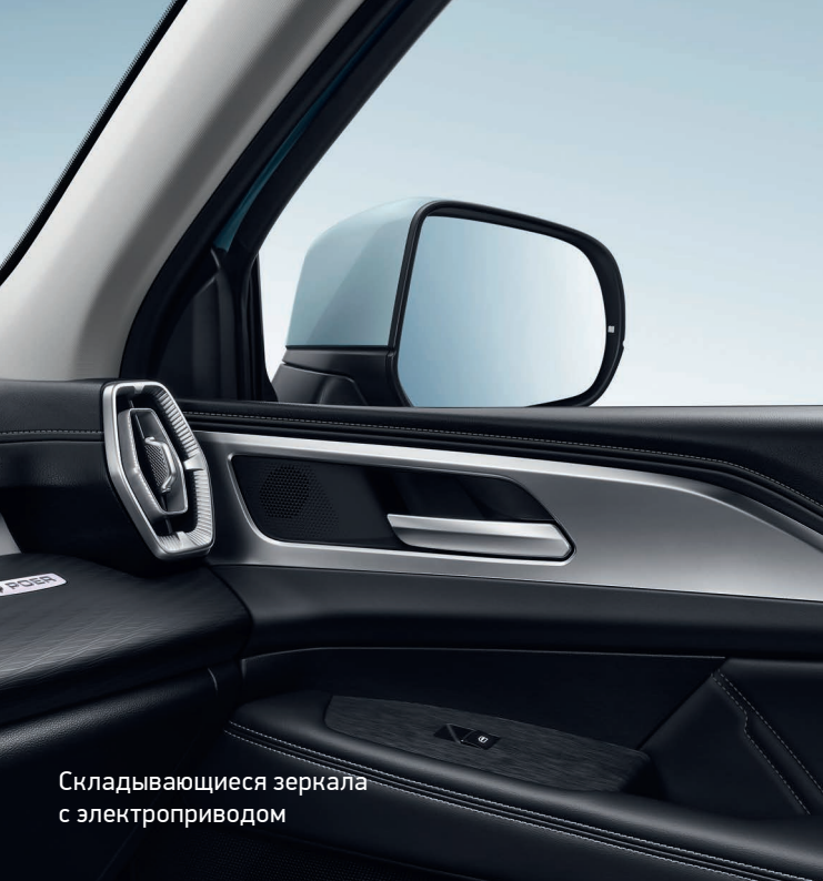
Складывающиеся зеркала с электроприводом