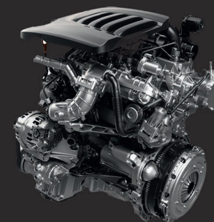
4C20B Бензиновый, 1967 см 3 , 190 л.с., 360 Нм

Бензиновый двигатель обеспечивает комфортную динамику как в городе, так и на трассе. Двухлитровый дизель расходует меньше топлива, при этом крутящий момент у него выше.