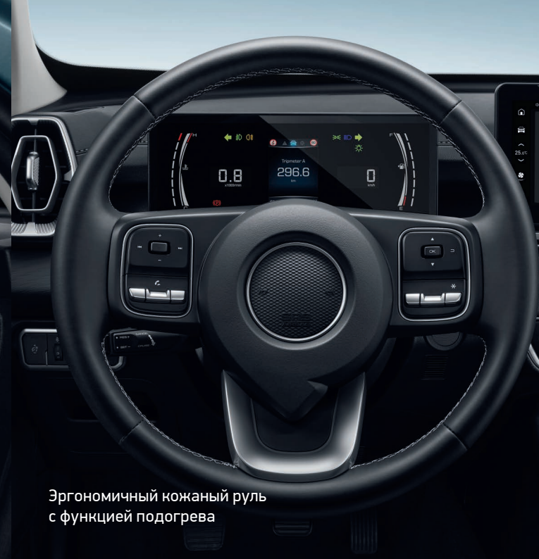
Эргономичный кожаный руль с функцией подогрева