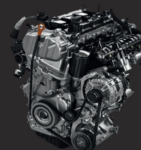
4D20M Дизельный, 1996 см 3 , 150 л.с., 400 Нм