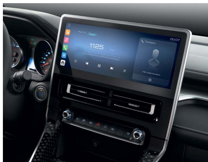
Мультимедийная система 10,25"