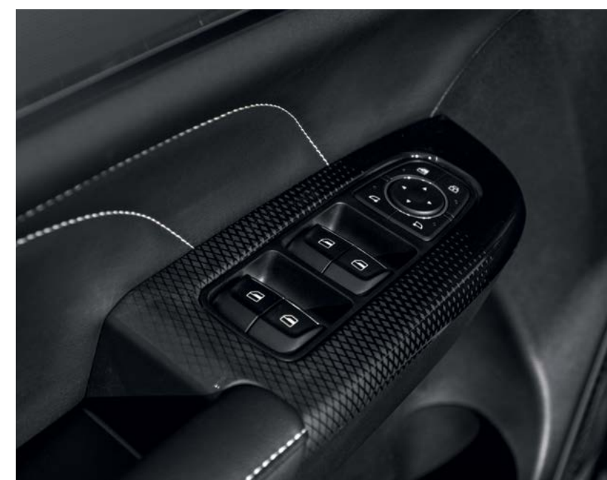
Электрорегулировка зеркал и стеклоподъемников