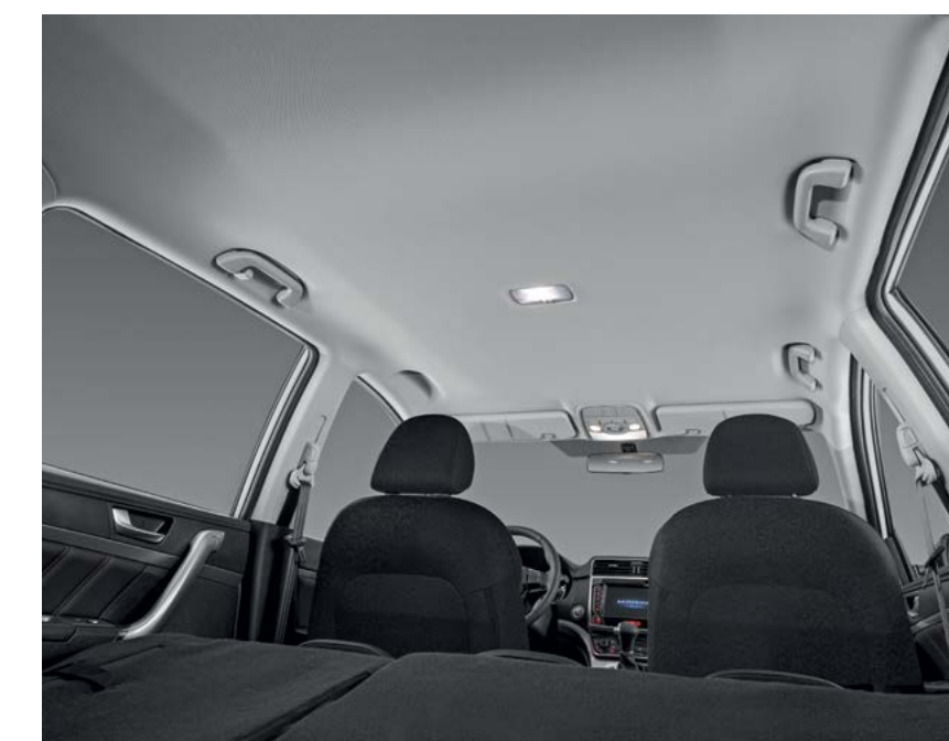
Вместительный багажник объемом 1700 л