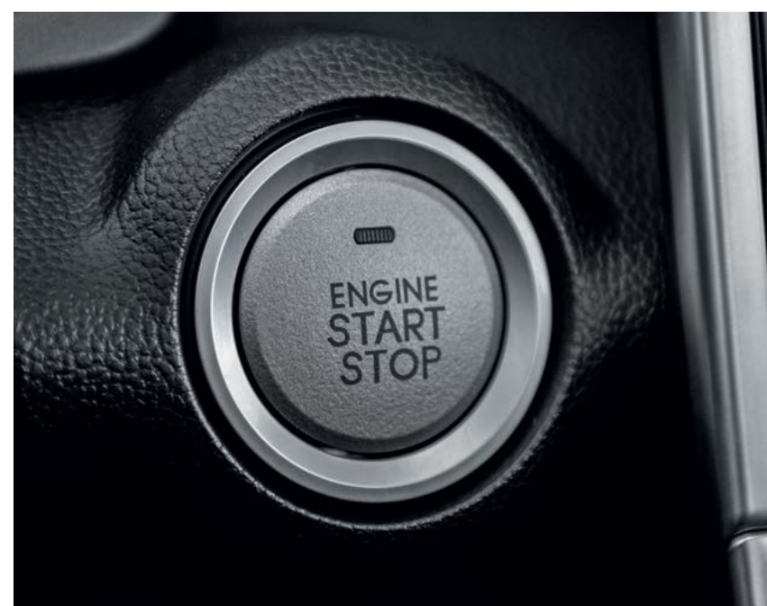
Запуск двигателя с кнопки