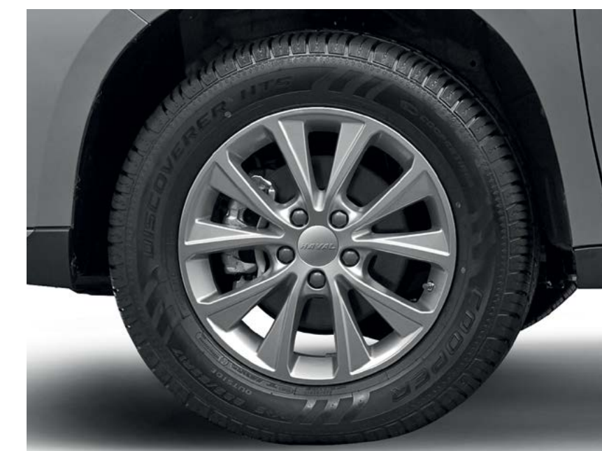
17" легкосплавные колесные диски