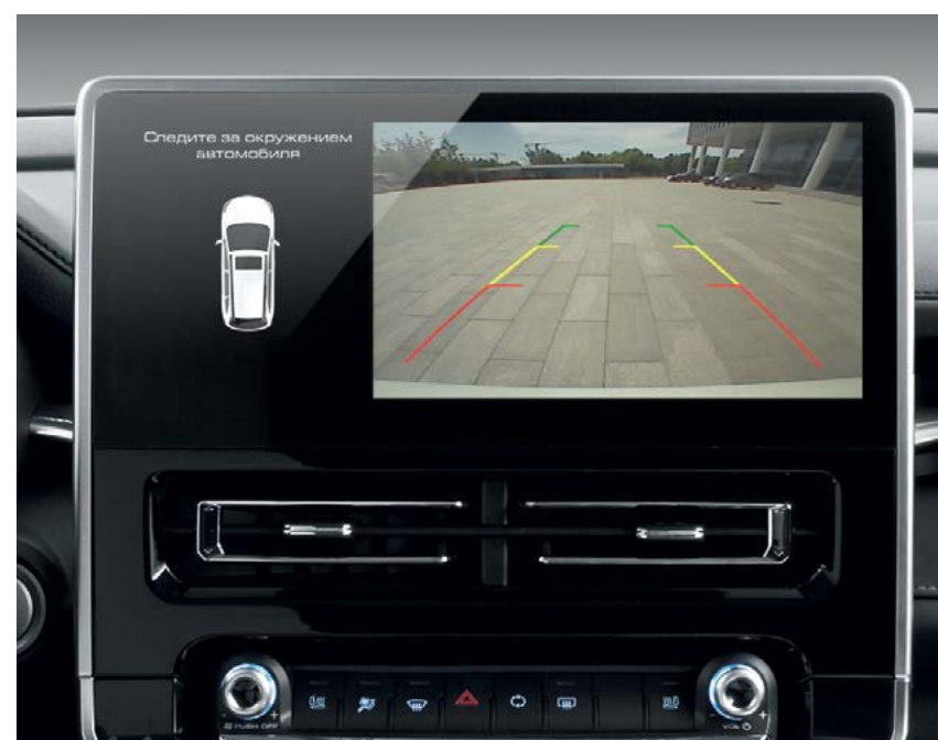
Камера заднего вида и парктроники