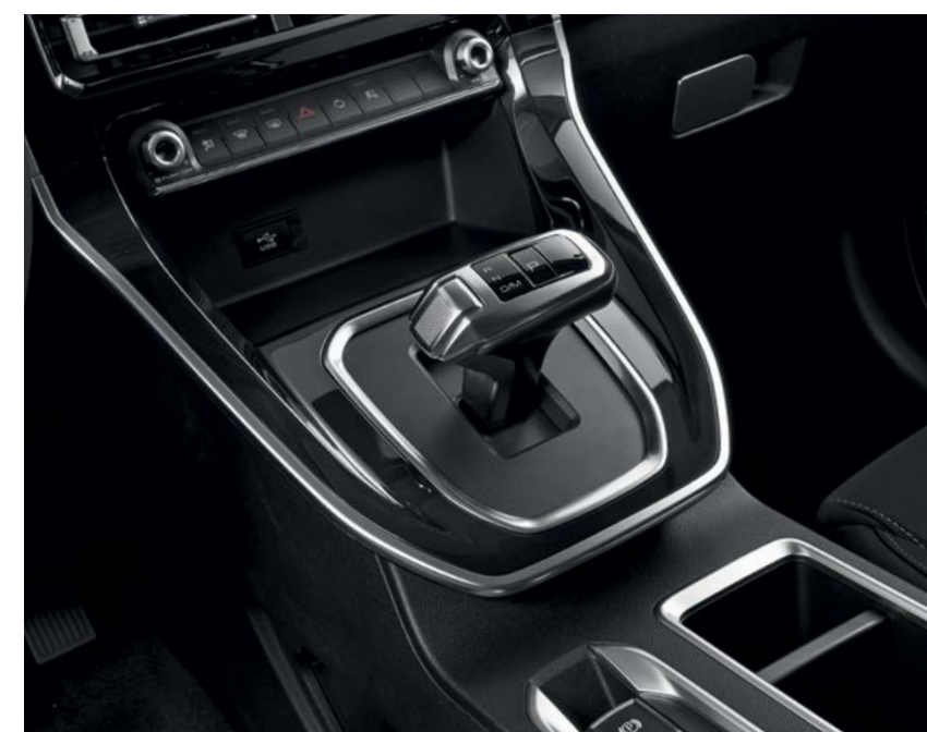
Надежная роботизированная АКПП